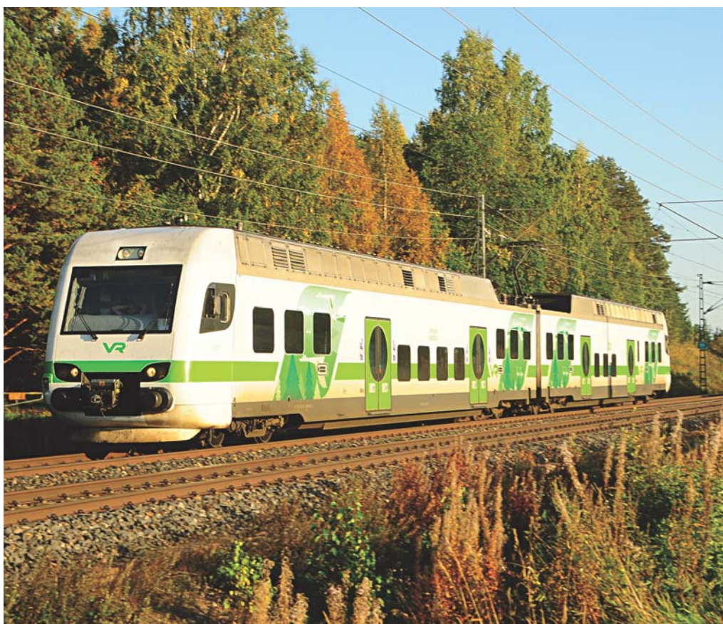
Die im Regionalverkehr von Helsinki nach Tampere respektive Lahti/Kouvola eingesetzten 30 CAF Sm4 EMU werden im Rahmen der Marktöffnung in eine Rollmaterial-Gesellschaft ausgliedert und entsprechend den Konzessionsvergaben ab 2022 „unter neuer Flagge“ fahren.

der HRT eingesetzten Stadler Sm5-EMU befinden sich im Besitz von Pääkaupunkiseudun Junakalusto Oy und sind somit unabhängig von der geplanten Aufteilung der VR Group. Der Erfolg der Marktöffnung wird sich an der Reduktion der öffentlich bezuschussten Gelder und der Erhöhung des heute noch auf 5,3 Prozent verharrenden Personenverkehrsanteils der Bahn messen lassen. pt