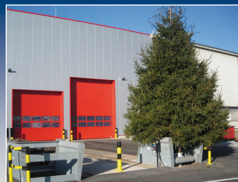
Prellbock mit Weihnachtsbaum

helmut.klose@klosegmbh.de www.klosegmbh.de